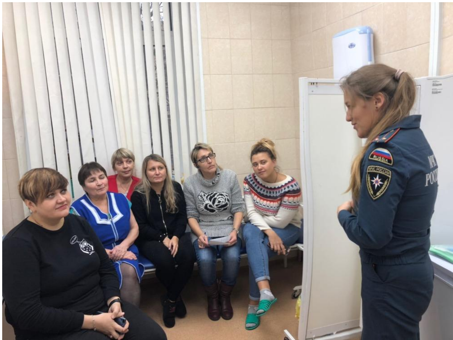
ОНДПР Центрального района 23.11.2018г.