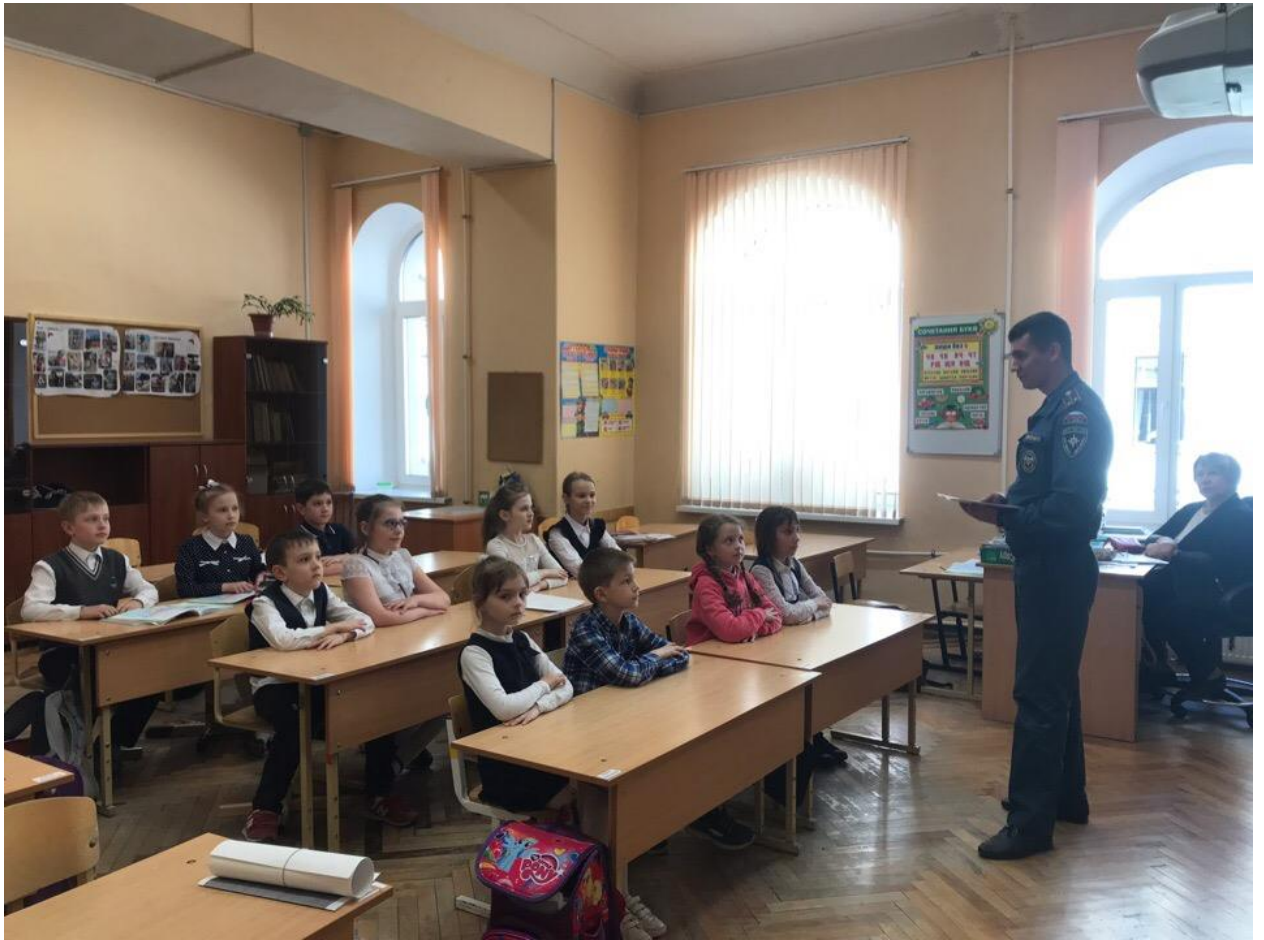
ОНДПР Центрального района ГУ МЧС России по Санкт-Петербургу 20.05.19