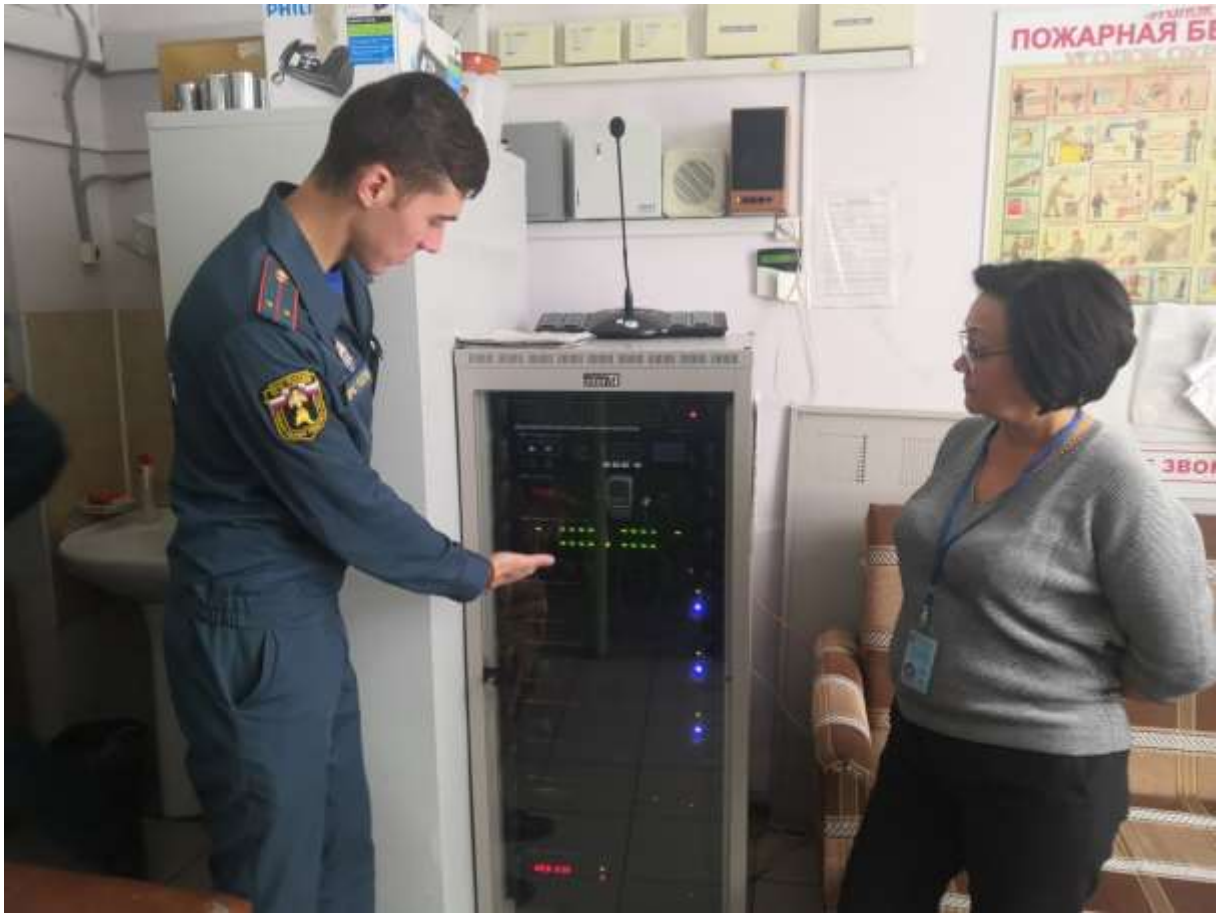
ОНДПР Центрального района 18.10.2019